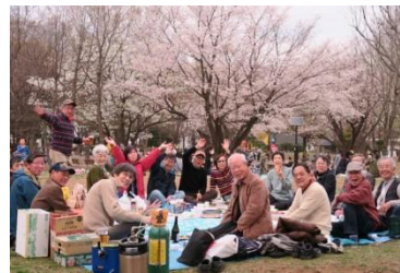
(暑気払い、花見会など)