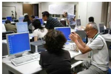
(パソコンふれあい広場)