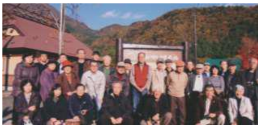
(富士吉田市青少年センター訪問)