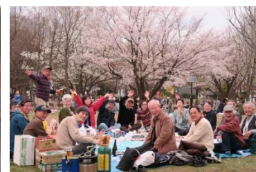
(暑気払い、花見会など)