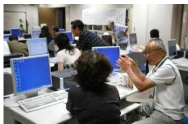
(パソコンふれあい広場)