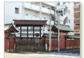
高札場は大國魂神社の御旅所にある

歴史を以て残された高札は、今や埃をかぶり佇む歴史の象徴となっていますが、歩く足を止めその前に立つと、時空を超え往時の人々の暮らしや文化が、庶民の生き生きとした笑顔や話し声とともに伝わってくるようです。（柴田洋子）