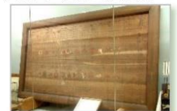
大國魂神社宝物殿に収蔵されている算額

因みに、このかるたの標識は大國魂神社の境内にありますが見つけにくいです。みなさんも、視点を変えて探してみてください。（山田詩子）