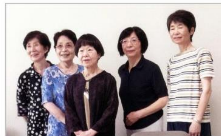
先生と4クラスのリーダー

[5.の内容] 画材をすべて持って行く海外旅行(ポルトガル・ブルガリア・台湾など)で、現地での絵手紙を通しての楽しい交流を行う