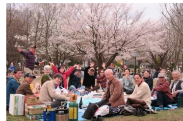
(暑気払い、花見会など)