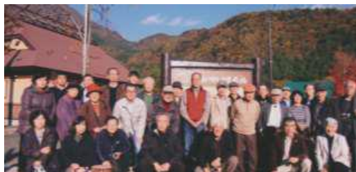
(富士吉田市青少年センター訪問)