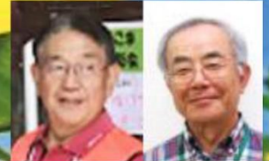
3. With コロナ時代の生き方