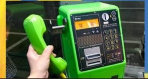
1. “離れてつながる”方法