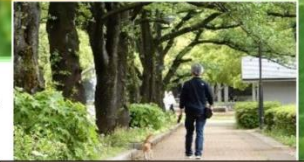
4. 運動と気晴らしには散歩