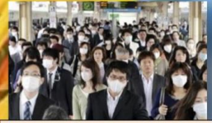
2. 自粛生活の体験を語る