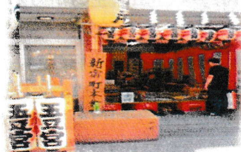
くらやみ祭の新宿町本会所(左)と山車(右)