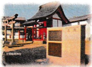
芝間稲荷神社と芝間の碑